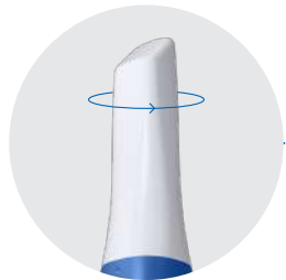
Punta reversible de 180°

Tome el control total de su escaneo con un clic. ¡No hay necesidad de numerosos cables y hubs! Simplemente con Plug & Scan utilice un solo cable para la conexión directa con un PC.