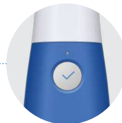
Botón de Inicio de Escaneo